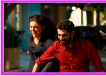
Sortie nationale le 18/02/2026

Il fallait sans doute beaucoup de cran pour réaliser une comédie romantique sur fond de dégradation d'un pays, sans tomber dans le désespoir gagnant une partie de la population. Pourtant c'est bien cette opposition entre les différents visages de la population qui traverse ce film sincère et vibrant de part en part. Véritable déclaration d'amour à Beyrouth et dénonciation des incapacités politiques, ce monde fragile et merveilleux séduit par son ton rassurant et le charme fou de son duo d'interprètes.