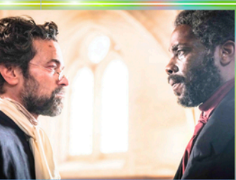
Sortie nationale le 14/01/2026

Adapté du livre L'Affaire de l'esclave Furcy de Mohammed Aïssaoui.