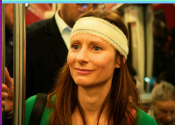
Sortie nationale le 18/03/2026

Rien ne va plus dans la vie d'Élise : engluée dans une relation toxique avec Léopold, elle se retrouve propulsée à la tête d'une troupe de théâtre, suite à la mort soudaine du metteur en scène dont elle était l'assistante. Submergée par des crises de panique, Élise vacille. Mais peut-être est-ce dans cette confusion qu'elle parviendra à se libérer de ses emprises et à reprendre le contrôle de sa propre vie ?